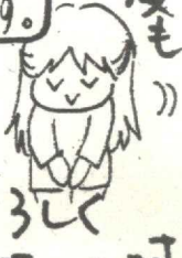
よろしく お願いしませう