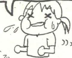
ジョギングで ダイエット中です

4~6月は、健康診断があります。 成長を知り、かかった病気がない かを調べる大切な行事です。 自分の体をみつめ直す良い機会です。