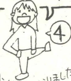
馬場小4年目になりました

ほけんだより「スマイル」では、 馬場小の保健情報について お知らせしていきます。